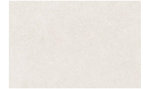
o similar / or similar Hormigón desactivado Deactivated concrete