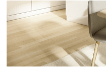
o similar / or similar Porcelanato imitación madera Wood effect ceramic tile